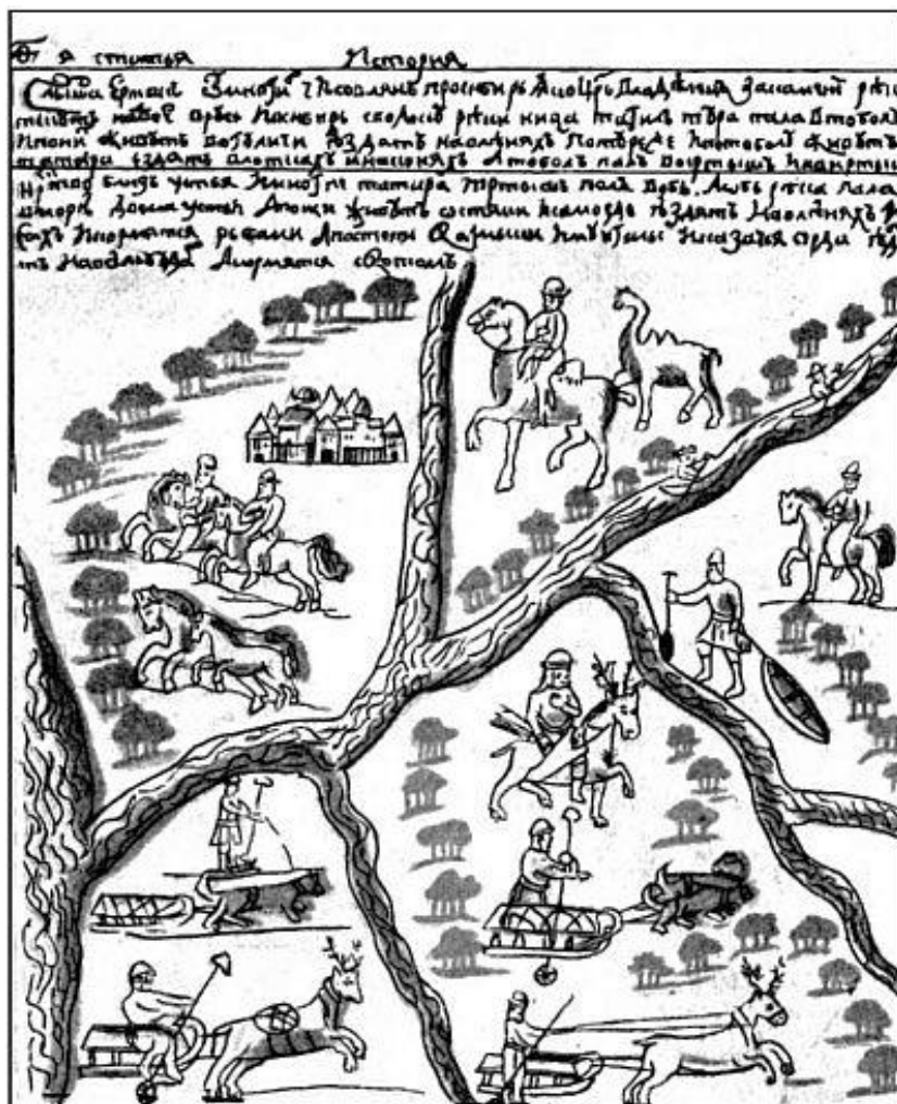
Таблица 1. Определите пространственные представления сторон света (вверху, внизу) на карте, изображённой на рисунке С.У. Ремезова.

"Слышал Ермак от многих чусовских [живущих по реке Чусовая] жителей про Сибирь: "С Камня реки текут на две стороны, в Русь и в Сибирь; с водораздела реки Ница, Тагил, Тура впади в Тобол. По ним живут вогулы, ездят на оленях. По Туре и по Тоболу также живут татары, ездят в лодках и на конях. А Тобол впади в Иртыш ... . А Иртыш впади в Обь. А Обь впади в море двумя рукавами, а по ней живут остяки и самоеды, ездят на оленях и псах, и питаются рыбой. А по Степи [живут] калмыки и монголы и Казачья Орда, ездят на верблюдах, а питаются мясом".